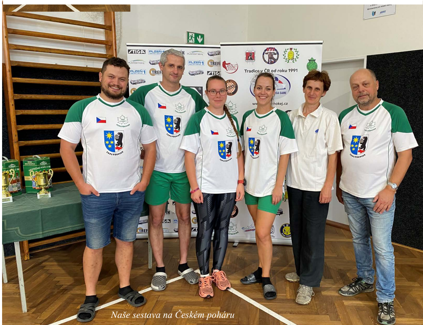
Naše sestava na Českém poháru