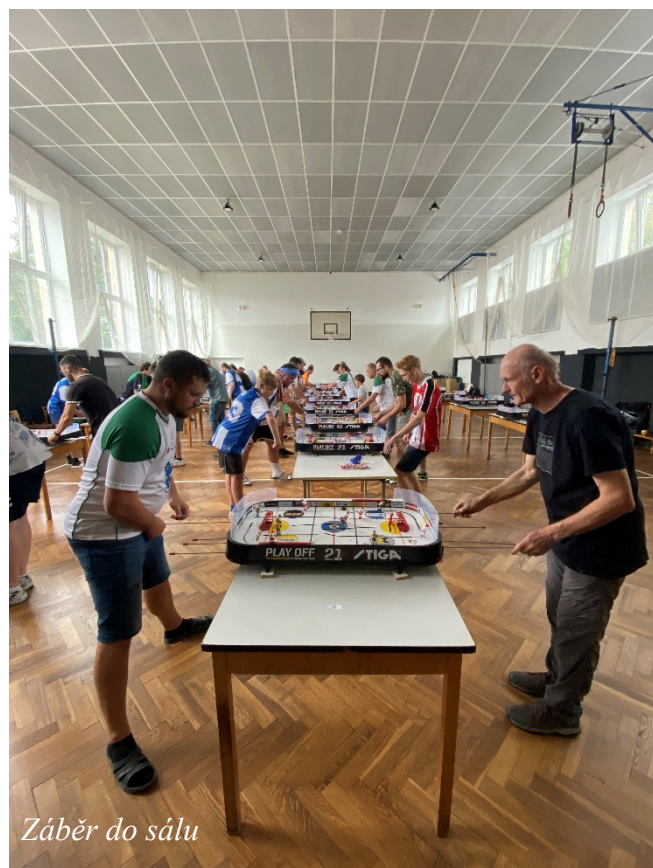
Záběr do sálu