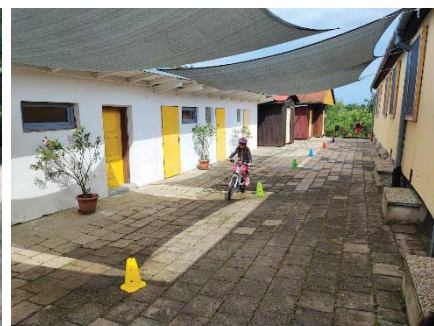
V další dny už nás čekaly kopce, zábava a poznání.