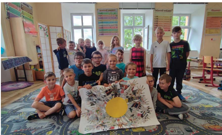
Předškoláci a prvňáci při společné práci v hodině výtvarné výchovy