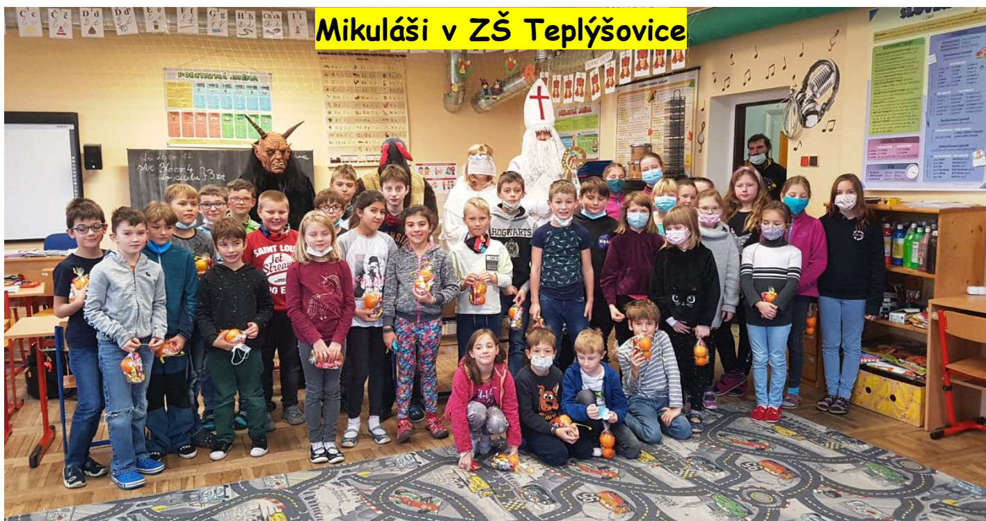
Mikuláši v ZŠ Teplýšovice