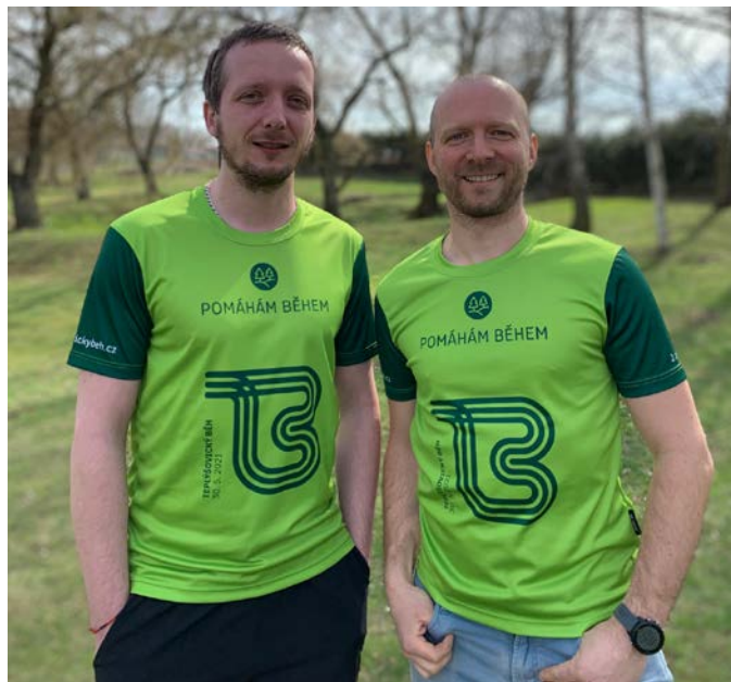
Funkční trička s motivem našeho běhu

Těší se na vás celý tým, který se podílí na přípravě Teplýšovického běhu.