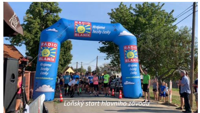
Loňský start hlavního závodu