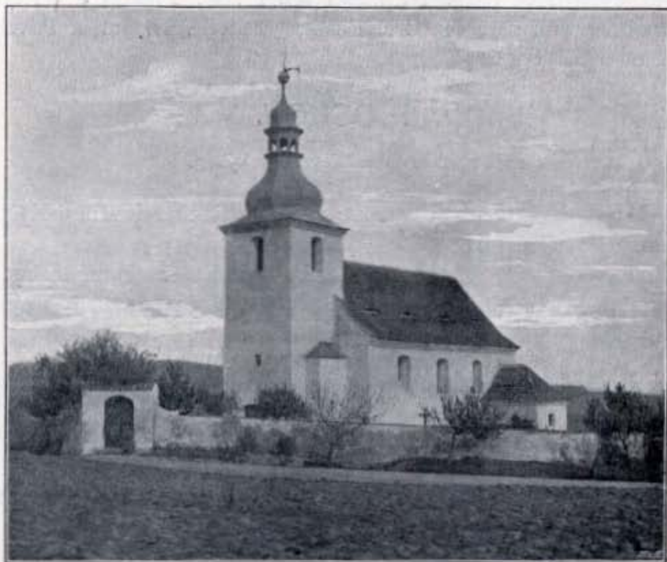
Obr. 360. Teplejšovice. Kostel.

FILIÁLNÍ KOSTEL SV. HAVLA (viz pohled na obr. 360, půdorys na obr. 361.), již ve XIV. stol. jako farní připomínaný, jednoduché stavení, pocházející v nynější podobě z r. 1756.