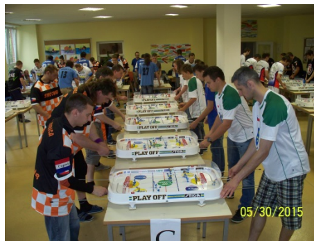
Záběr ze zápasu s béčkou Chebu, který jsme prohráli 9:13