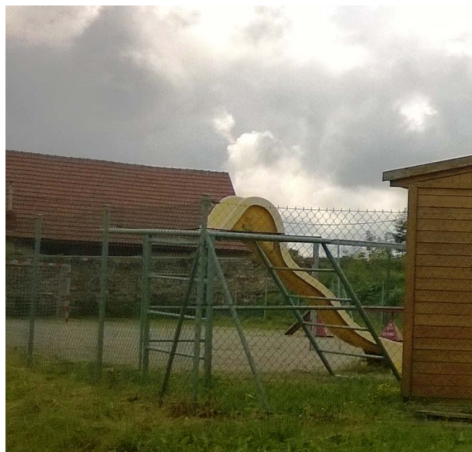
nahore před úpravou, dole po rekonstrukci