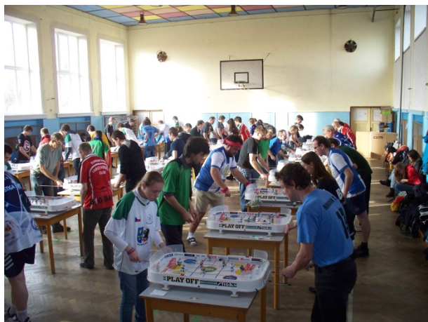
Celkový pohled do sálu při dopoledních zápasech v základních skupinách.