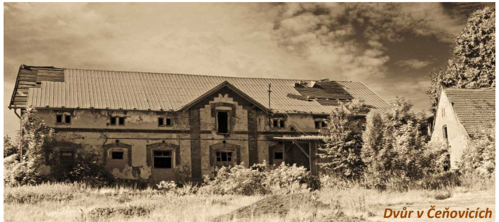
Dvůr v Čeňovicích