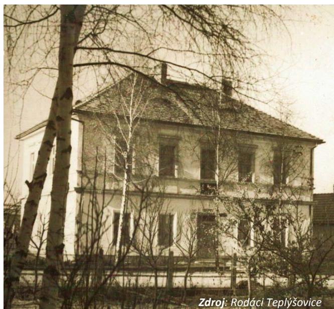
Zdroj: Rodáci Teplýšovice

Po nástupu školní docházky jsme byly trochu více v šoku, nejen já, ale hlavně naše dvě holčičky, které zažily „normální školu“ a mohou posoudit ten obrovský rozdíl. Ať od vstřícnosti laskavého personálu, který se stará o děti, aby se mohly učit v čistotě a měly plná břicha, tak samozřejmě hlavně po pedagogický sbor, který ze školy, kousek od nás, dělá pohádku plnou snů. Kde nenásilnou formou učí děti, aby obstály v životě se vším všudy.