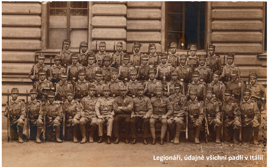
Legionáři, údajně všichni padlí v Itálii

Na čest jejich památce byl pak v Teplýšovicích dne 13. září 1925 odhalen pomník padlým hrdinům z 1. světové války. Sbor dobrovolných hasičů za přispění obce a občanstva jej tehdy postavil za 8 416 Kč.