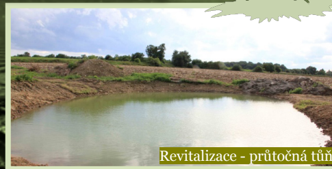
Revitalizace - průtočná tůň