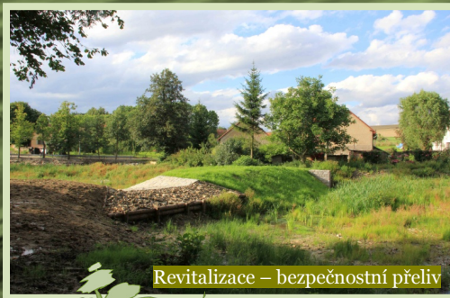
Revitalizace - bezpečnostní přeliv