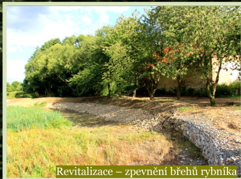
Revitalizace - zpevnění břehů rybníka