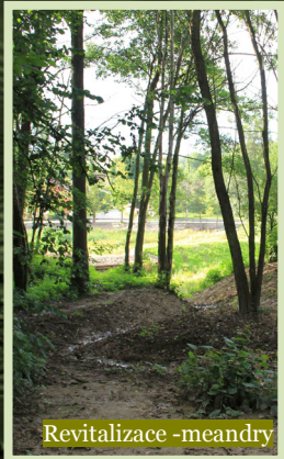
Revitalizace - meandry

Pořízen mulčovač Hurikán ( 50 000,-Kč) pro údržbu cest podél alejí - společný projekt mikroregionu CHOPOS.