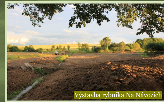
Výstavba rybníka Na Návozích