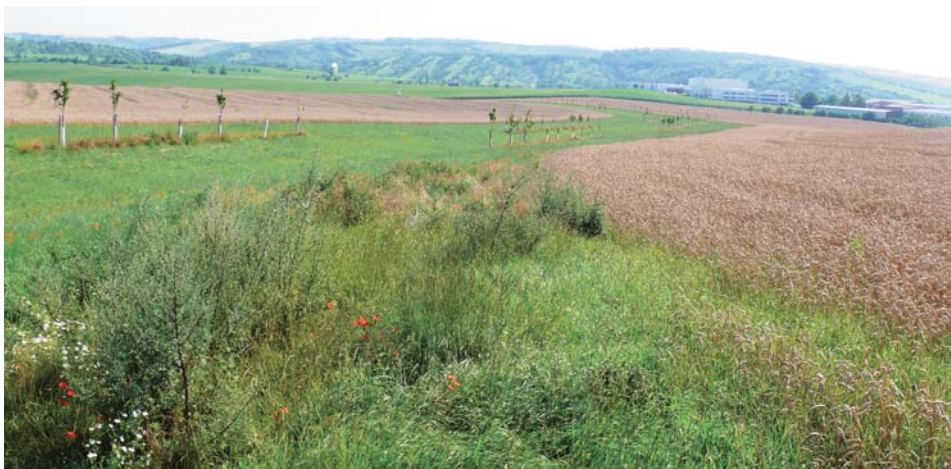
Zatravněná údolnice v k.ú. Starovice