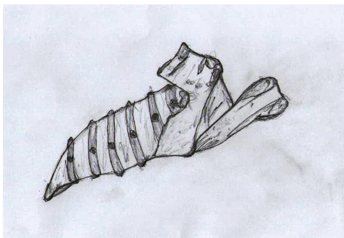
KRESBA PATRIK BLÁHA