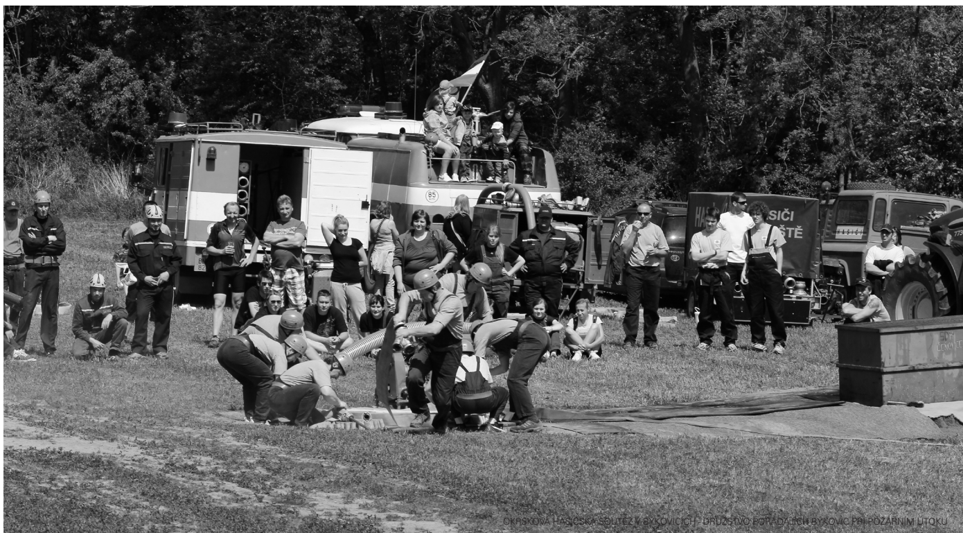
OKRSKOVÁ HASIČSKÁ SOUTĚŽ V BÝKOVICÍCH / BRUŽSTVO POŘADYČIN BÝKOVIC PŘI POZÁRNÍM ÚTOKU

Informační čtvrtletník pro Babčice, Bořeňovice, Budkov, Býkovice, Dolní Podhájí, Hlíňánky, Horní Podhájí, Jezero, Myslíc, Pecínov, Skalici, Střížkov, Struhařov, Svätý Jan a Věřice. Na období: třetí čtvrtletí roku 2012.