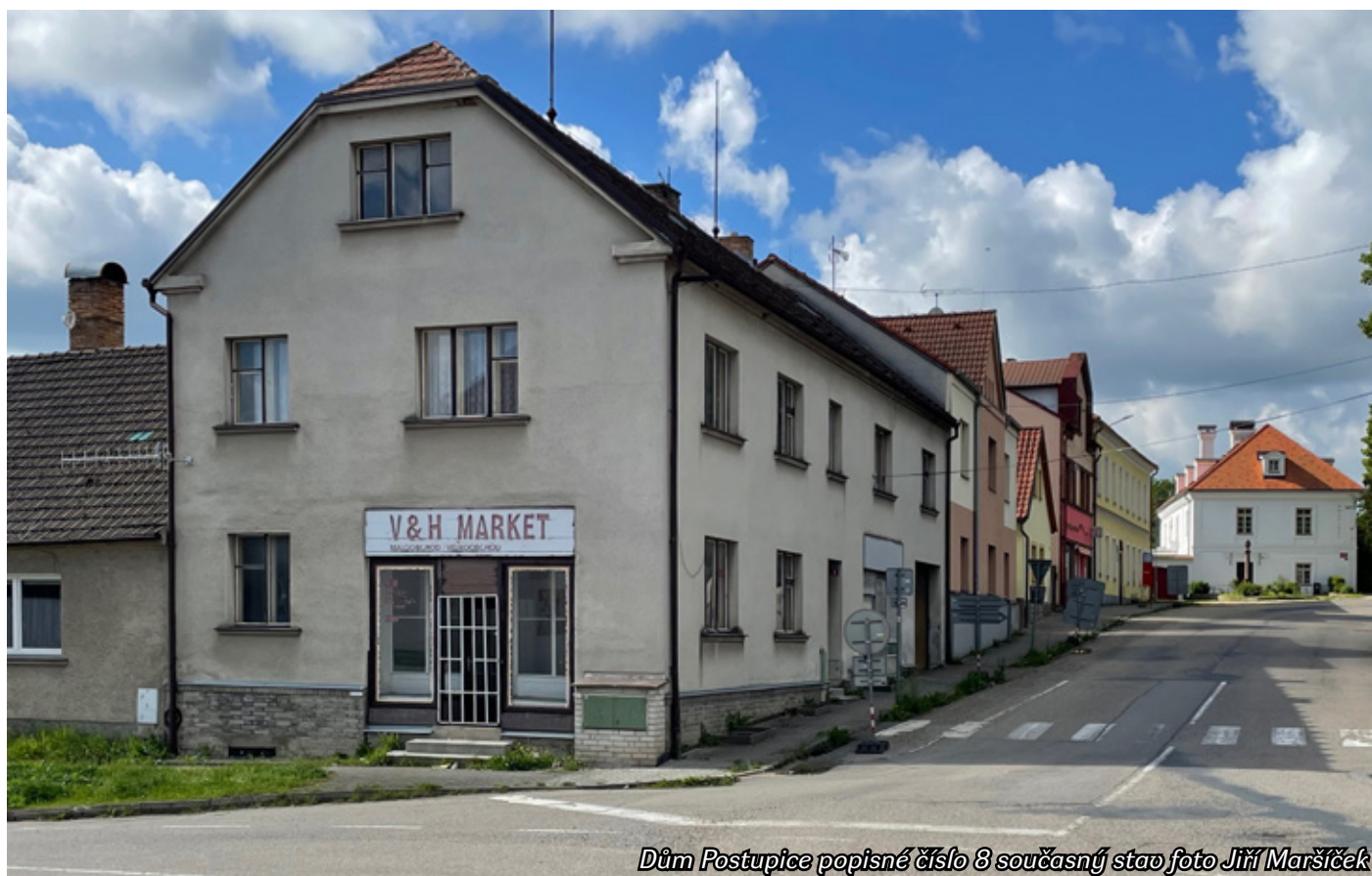
Dům Postupice popisné číslo 8 současný stav