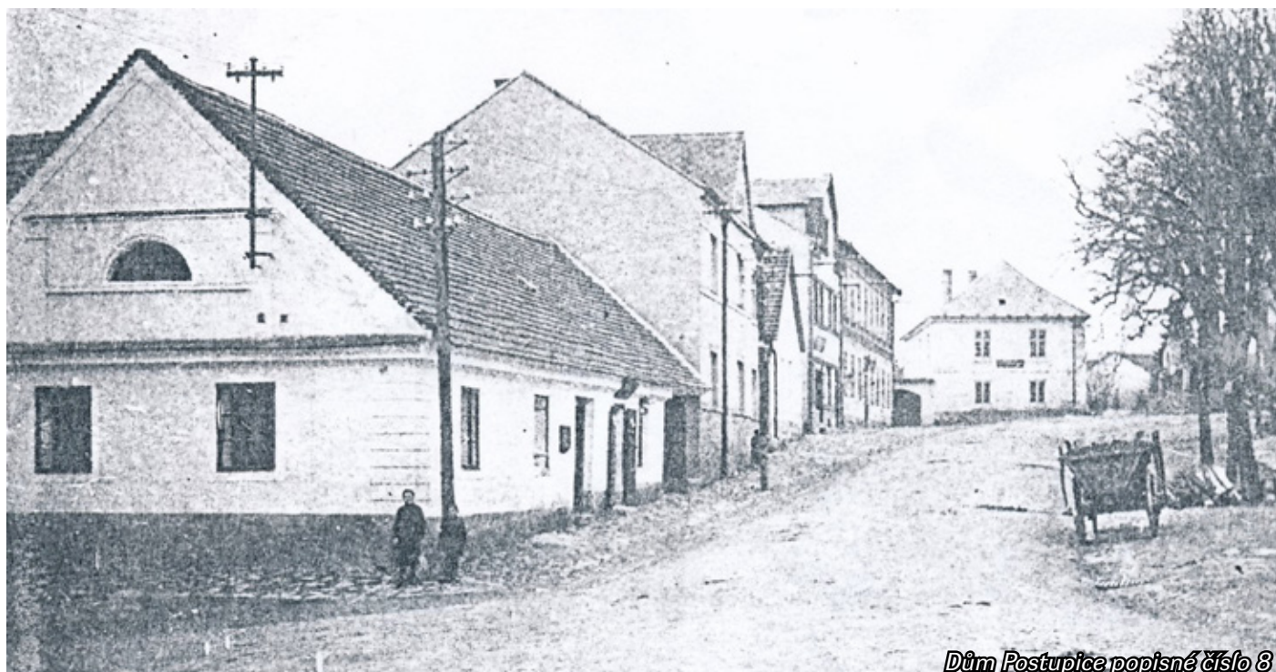
Dům Postupice popisné číslo 8