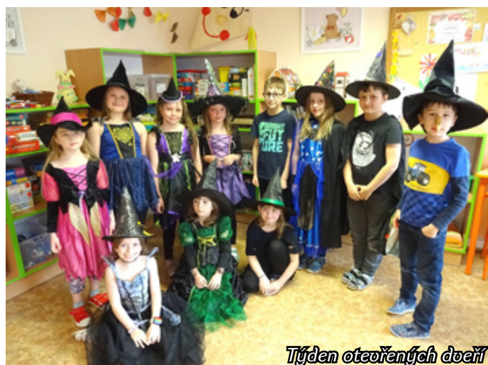
Týden otevřených dveří

A pak už jsme se těšili na jaro a s ním i na Velikonoce – vyráběli jsme na velikonoční jarmark, přispěli jsme také dárečky pro naše budoucí prvňáčky. V dubnu byla naše družina otevřena všem maminkám, tatínkům, babičkám s dědečky v „Týdnu otevřených dveří“. Mohli jsme s nimi hrát naše oblíbené hry, stavět stavebnice, ale i vyrábět ve výtvarné dílničce. Tento týden byl zakončen „Čarodějnickým rejem“, kdy jsme se vyřádili v tancování, ale i soutěžích a hrách, které pro nás byly připraveny. Počátkem měsíce května vypukly velké přípravy pro naše maminky. Přichystali jsme si pro ně vystoupení v podobě tanečků, pásma básniček a her na flétnu. K tomu jsme přidali malé přáníčko, svícen a kytičku s velkou pusou. Tímto bychom chtěli poděkovat učitelům a vedení školy, kteří nás v naší činnosti podporují. Rodičům za zájem a účast při společných akcích a také starším spolužákům – dívkám páté třídy, kteří s mladšími spolužáky tráví v I. oddělení ŠD volný čas (učí ty mladší dodržovat pravidla, pomáhají s hrami a soutěžemi – karneval, čarodějnický rej nebo při nácviu na besídku ke Dni matek) a žákům osmé třídy, kteří nám také pomáhají (při akcích „Noc s Andersenem“, besídka a posezení ke Dni matek).