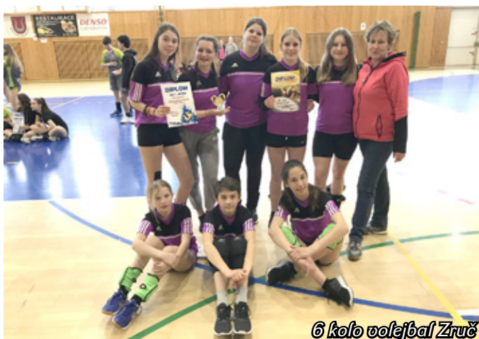
6 kolo volejbal Zruč