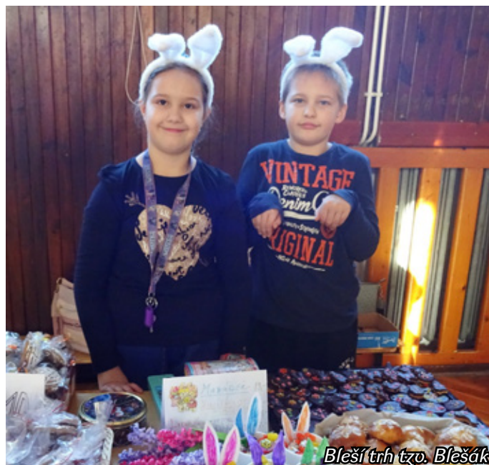
Bleší trh tzo. Blešák