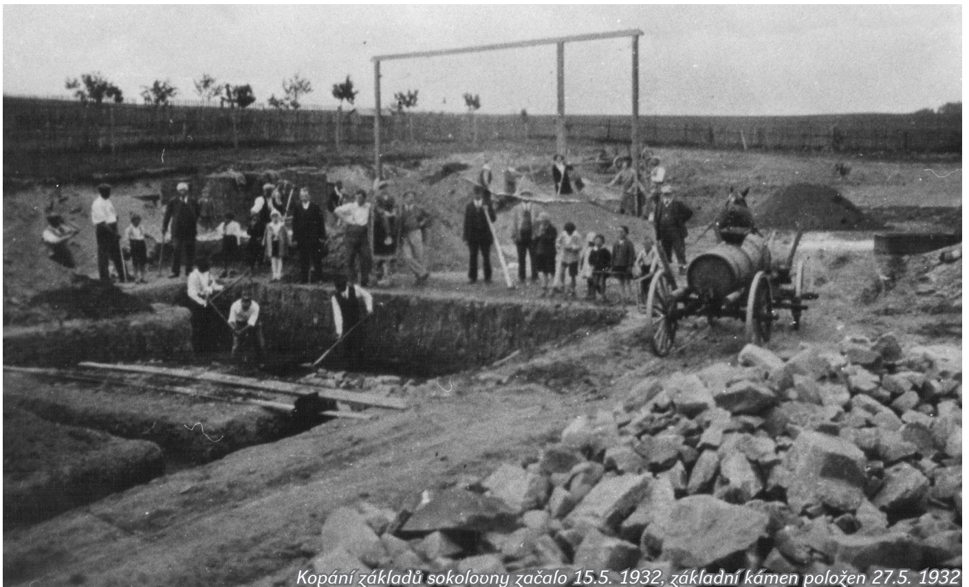
Kopání základů sokolovny začalo 15.5. 1932, základní kámen položen 27.5. 1932