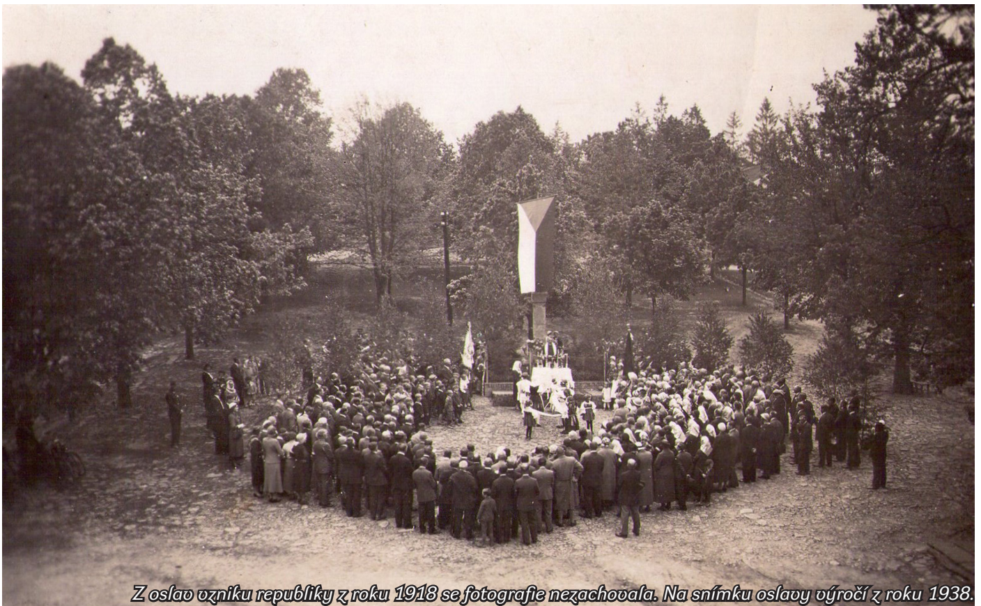
Z oslavy vzniku republiky z roku 1918 se fotografie nezachovala. Na snímku oslavy výročí z roku 1938.

Buchov • Dobříčkov • Čelivo • Holčovice • Jemniště • Lhota Veselka • Lísek • Milovanice Miroslav • Mokliny • Nová Ves • Postupice • Pozov • Roubíčková Lhota • Sušice • Vrbětín