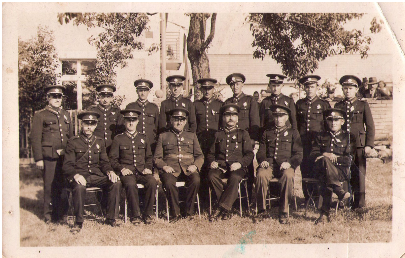
Hasiči z Jemniště a Lísku ve slavnostních uniformách zřejmě při coičení v roce 1935.