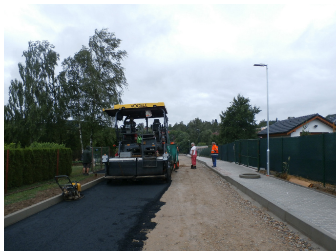
Ulice V Sadech