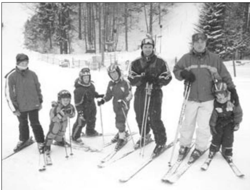
V Orlických horách

V neděli, dva dny po příjezdu z hor, jsme při schůzce mladých hasičů pletli pomlázky na pondělní koledování. Na „čáry“ jsme na parcele pana Zemana v Jemništi, tak jako v roce 2007, pálili čarodějnice, pekli jsme buřty a hráli fotbal. V sobotu třetího května se družstvo mladých hasičů zúčastnilo v rámci okrskové soutěže dospělých vloženého závodu dětských družstev v požárním útoku Plamen. Zúčastnili se mladí hasiči Jemniště, Čerčan a Čeňovic.