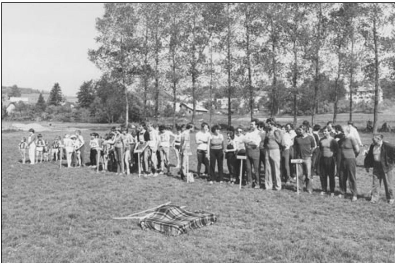
Na snímku jsou účastníci 1. ročníku Běhu kolem Paperáku v roce 1983. Za povšimnutí stojí zajímavé stupně vítězů.

Postupický Běh kolem Paperáku už od svého počátku získal velký ohlas v širokém okolí a od 2. ročníku byl zařazen do Kalendáře masových akcí Sportpropag Praha. Každoročně se zúčastňují běžci z celého kraje.