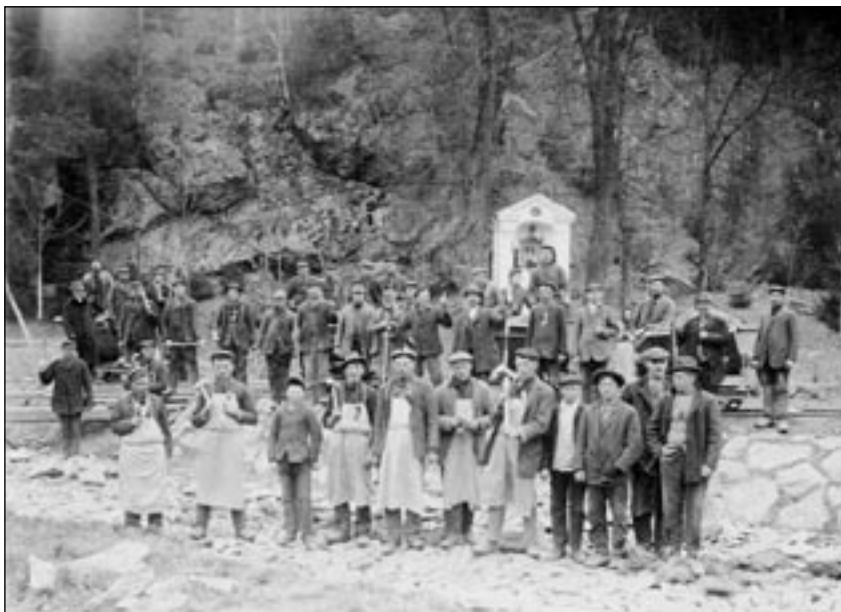
Bratránci při stavbě navigace u svatojánské kapličky na Podlesí

Buchov, Dobříčkov, Čelivo, Holčovice, Jemniště, Lhota Veselka, Lísek, Milovanice, Miroslav, Mokliny, Nová Ves, Postupice, Pozov, Roubíčková Lhota, Sušice, Vrbětín