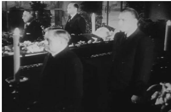
Pohřeb Jana Masaryka 13. března 1948 – proč již třetí den po smrti?

lidmi pro konečnou odpověď. Masaryk ale jakoukoli spolupráci odmítá a proto přichází na řadu plán B – jeho vražda alias „sebevražda“.