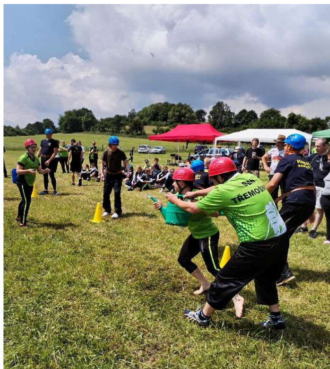
Kbelíková štafeta mezi domácí Třemošnicí a družstvem Samechova