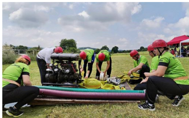
Domácí družstvo při přípravě útoku

nejslabších strojů PS 8 nazvaný „Třemošnická osmička“. Organizátoři opět připravili plochu „Na Vinici“ za velké pomoci SPZV, která zde sklídila travní porost. Díky patří i obci Ostředek za finanční podporu celé soutěže, mezi sponzory musíme vyzdvihnout firmu Bakker za poskytnutí ovoce pro zúčastněné, stejně jako SPZV Ostředek za klobásky a poděkování i SDH Hvězdonic za zapůjčení výčepní stolice na limonádu a pivo. V neposlední řadě bychom jménem výboru SDH chtěli poděkovat všem hasičům, kteří se aktivně zapojili do organizace akce. Letos jsme si pořídili i vlastní gril, takže nám odpadla jedna starost. Opět se soutěžilo o putovní poháry jak pro dětské kolektivy, tak pro smíšená družstva dospělých. V dětské kategorii bylo původně přihlášeno 6 družstev, Samechov nakonec přivezl jedno dětské družstvo. A výsledky: 1. Ostředek B s útokem 39,80 s a celkovým časem včetně obou štafet 5:32,40 minut, převzal zároveň putovní pohár od Hvězdonic, druhé místo obsadil Ostředek A s útokem 41,72 a celkovým časem 5:46,50 minut, na třetím stupínku skončily děti ze Samechova s útokem 33,91 a celkovým časem 5:49,79 minut, čtvrté a páté místo obsadily podstatně mladší děti z Hvězdonic s celkovými časy 10:28 a 12:17 minut. V kategorii dospělých mělo startovat devět družstev, bohužel nedorazily ale týmy z Dalov a Třebešic. I tak sedm družstev zahájilo opět nejdříve útoky, po nich pak následovala kbelíková štafeta a na závěr štafeta s hadicí a proudnicí.