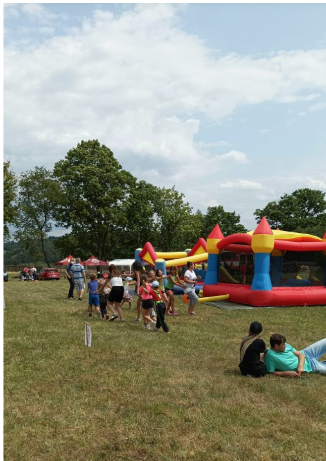
Dva hrady, kde se děti pěkně vyřádily

O týden později, 22. července, jsme zorganizovali druhý vrchol sezóny a sice „Hasičský dětský den“, na kterém měli největší podíl manželé Fehéroví, Jitka Veselá, a pak řada dalších pomocníků, neboť bylo vytvořeno 10 stanovišť s různými úkoly – 1. zatloukání hřebíků do dřeva, 2. požární slalom, 3. poznávačka puzzle – barvy a zvířátka, 4. stříkání džberovkou, 5. skládání TETRIS, 6. dojení krávy, 7. házení kroužků na cíl, 8. lovení rybiček, 9. sportování s NINJOU, 10. házení míčků na domeček. Do všech 10 úkolů se zapojilo 45 dětí a celkově se hasičského dětského dne zúčastnilo kolem 60 dětí. Mimo disciplíny byly v provozu dva dětské skákací hrady a na závěr samozřejmě i tradiční hasičská pěna. Organizačně se dětský den velice povedl, přálo nám i počasí a proběhla v rámci dne i soutěžní dětská diskotéka.