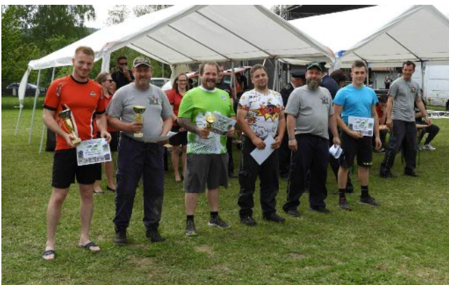
Pořadí muži: 1. Dalovy A, 2. Dalovy B, 3. Třemošnice, 4. Hvězdonic, 5. Třebešice, 6. Ostředek

Pak se sbor již intenzivně připravoval na hlavní domácí soutěž, kterou pořádáme od roku 2007. Přes dvouletý výpadek covidových ročníků 2020 a 2021 to letos byl již 15. ročník soutěže