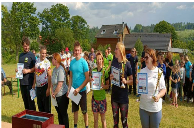
Vyhodnocení soutěže dospěláků

Výsledky dopadly následovně: na sedmém místě skončil tým Samechov ALL STARS s útokem 57,24 vteřiny a celkovým časem 7:00,15 minut, šesté místo obsadilo družstvo z Hvězdonic s útokem 47,00 vteřiny a celkovým časem 6:25,60 minut, pátý skončil Samechov 1 s útokem 41,93 vteřiny a celkovým časem 6:12,87 minut a čtvrté místo obsadilo družstvo Ostředek s útokem 40,35 vteřiny a celkovým časem 6:11,73 minut. Pro pohárová umístění si doběhlo na třetím místě družstvo Třemošnice A s útokem 34,25 vteřiny a celkovým časem 5:57,19 minut, před nimi na druhém stupínku skončil smíšený tým Samechov A s útokem 37,47 vteřiny a celkovým časem 5:55,99 minut a vítězné družstvo Třemošnice B mělo útok za 29,18 vteřiny a celkový čas 5:48,23 minut. Domáci tak obhájili putovní pohár z loňského roku. Celá soutěž se vydařila a všem se velice líbila.