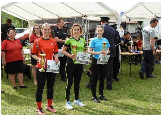
Pořadí ženy: 1. Dalovy, 2. Třemošnice, 3. Ostředek