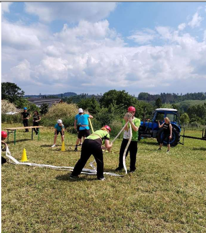
Souboj 2. družstva Třemošnice s borci z Ostředka při druhé štafetě

Výsledky dopadly následovně: na sedmém místě skončil tým Samechov ALL STARS s útokem 57,24 vteřiny a celkovým časem 7:00,15 minut, šesté místo obsadilo družstvo z Hvězdonic s útokem 47,00 vteřiny a celkovým časem 6:25,60 minut, pátý skončil Samechov 1 s útokem 41,93 vteřiny a celkovým časem 6:12,87 minut a čtvrté místo obsadilo družstvo Ostředek s útokem 40,35 vteřiny a celkovým časem 6:11,73 minut. Pro pohárová umístění si doběhlo na třetím místě družstvo Třemošnice A s útokem 34,25 vteřiny a celkovým časem 5:57,19 minut, před nimi na druhém stupínku skončil smíšený tým Samechov A s útokem 37,47 vteřiny a celkovým časem 5:55,99 minut a vítězné družstvo Třemošnice B mělo útok za 29,18 vteřiny a celkový čas 5:48,23 minut. Domáci tak obhájili putovní pohár z loňského roku. Celá soutěž se vydařila a všem se velice líbila.