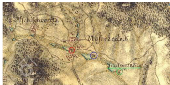
Horní (červeně), Prostřední (modře) a Dolní (zeleně) mlýn v Ostředku, I. vojenské mapování, výřez, 1764-1768.