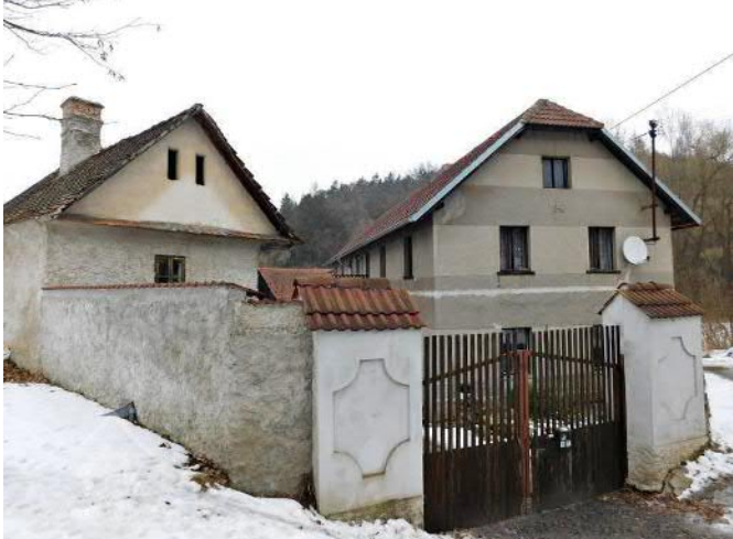
Petříčkovský mlýn (stav r. 2014 a 2017)

Príslušníci Müllerova rodu, kteří žili a provozovali mlynářské řemeslo v Ostředku, sem přišli od Petrovic u Sedčan.