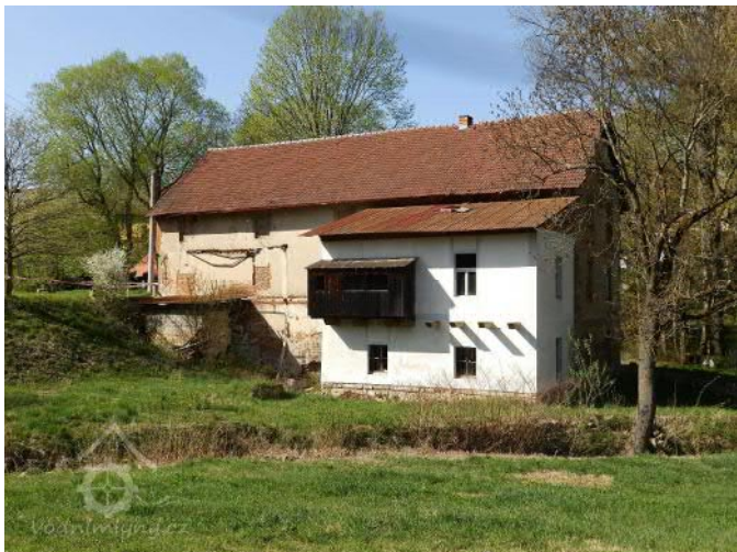
Horní mlýn čp. 14 (stav v r. 2018)