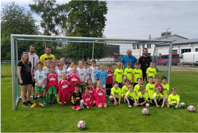
Po přátelském utkání v Teplýšovicích, které se konalo 5. června.

Vedení klubu intenzivně řeší, co s přípravkou. Sázava další pokračování společné mladší přípravky 4+1 odmítla, a tak se hledá klub, který by se s námi pro sezónu 2021/22 spojil. Byla by škoda, aby naši nejmenší neměli možnost hrát. Aktuálně jednáme s TJ JAWA Divišov, uvidíme, přihláška se musí podat do 21. června.