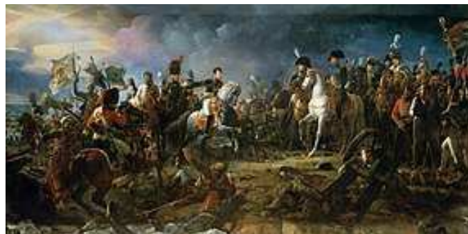
Bitva tří císařů u Slavkova. Generál Rapp přivazuje Napoleonovi ruské prapory a zajatého knížete Repnina

Před 200 lety, 5. května 1821, zemřel malý velký muž - Napoleon I. Bonaparte, který byl v roce 1805 na našem území. Člověk, který prošel řadou dobrých i zlých období, ovlivnil velmi dějiny Francie, ale i dalších států jako Ruska, Pruska i Rakousko-Uherska například bitvou tří císařů u Slavkova v roce 1805.