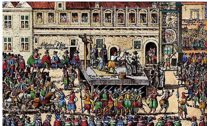
Verzeichnis was gestalt der Graff von Schlick und andre hohe und Niderstaunds Perjonen hingericht und vollzogen worden.

Přestože Staroměstské náměstí tehdy zaplnily tisíce zvědavců, očitých svědků poprav, nezachovalo se nám zcela jednoznačné pořadí vykonávaných rozsudků ani jejich přesný průběh.