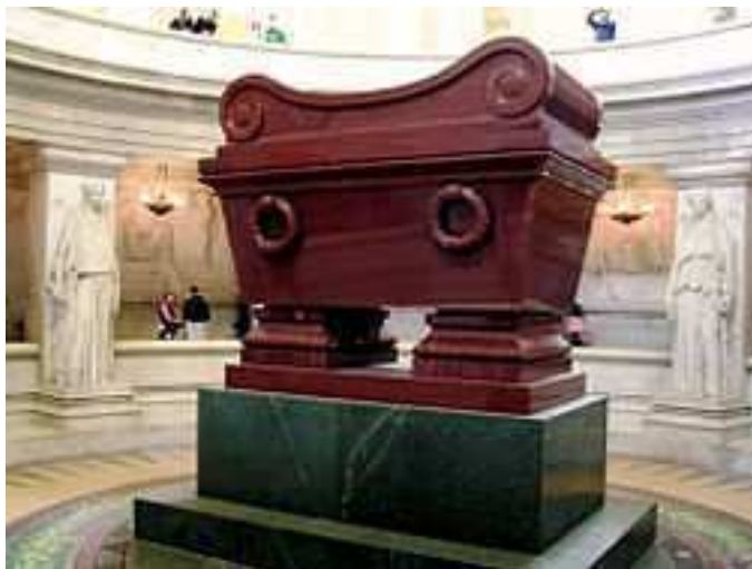
Tumba s Napoleonovými ostatky v pařížské Invalidovně.

Po abdikaci Napoleona v roce 1814 byla Marie Luisa se synem nucena odjet zpět do Rakouska a již se do Francie nevrátila. To bylo naposledy, co Napoleon I. viděl svého syna. Dědeček Napoleona II., rakouský císař František I. z něj učinil vévodu Zákupského, který mimo jiné vlastnil i Tachlovice, Kácov, Korunní Poříčí, Ploskovice, Žandov, Zvoleněves, Buštěhrad a další sídla včetně Černínského paláce v Praze. Tento jediný přímý potomek Napoleona I. Bonaparta onemocněl tuberkulózou a v pouhých jednadvaceti letech svého života 22. července 1832 ve Vídni zemřel. Jeho ostatky byly 22. prosince 1940 na rozkaz Adolfa Hitlera převezeny do Francie do pařížské "Invalidovny", kde jsou uloženy u sarkofágu Napoleona I.