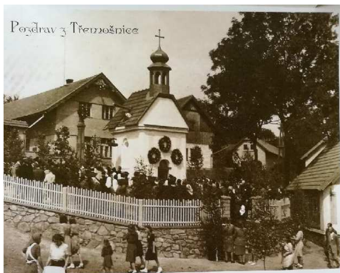
Pozdrav z Třemošnice

Vážené rodáči, občané a přátelé Třemošnice,