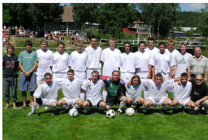
Nováček OP – červenec 2006