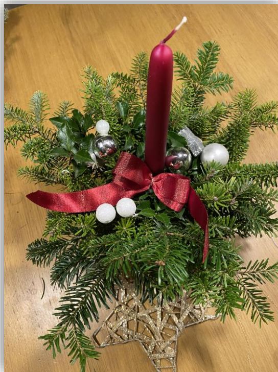
Návod, jak si svépomocí vyrobit vánoční svícen, naleznete uvnitř zpravodaje.