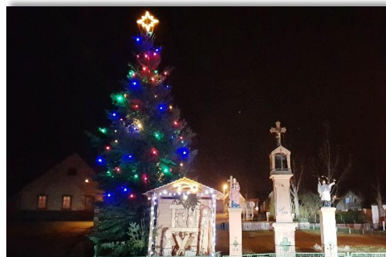
Betlém a vánoční stromek – Mrač 2020