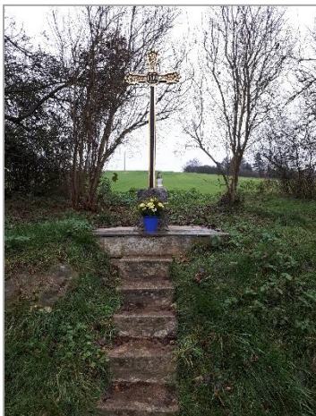
Litinový křížek na rozcestí

V letošním roce se nám podařilo zdařile obnovit obě sakrální stavby v Křenčíně. Kamenný křížek je umístěn na hranici katastru s Poříčím nad Sázavou pod dvěma lípami v prudkém stoupání původní cesty do Mrače.