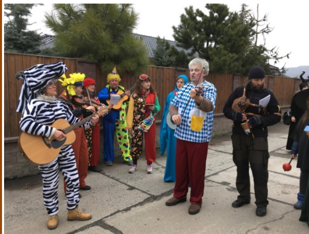
více čtete na straně 5