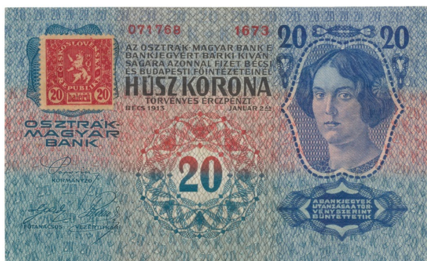
Kolkovaná státočka v hodnotě 20 Kč

nová rozluka, která v hotovostním oběhu spočívala v okolkování stávajících rakousko-uherských bankovek.