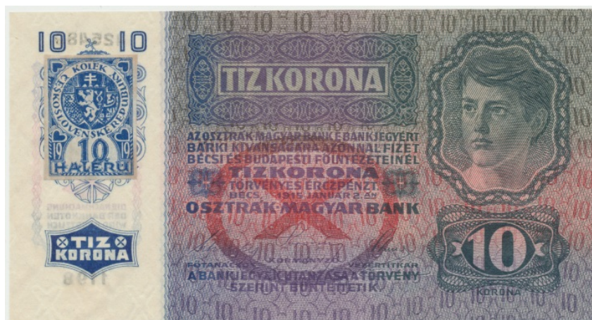
Kolkovaná státočka v hodnotě 10 Kč

V březnu přesně před sto lety proto vznikly první československé peníze. Podle zákona, předloženého ministrem financí dr. Aloisem Rašínem (1867-1923), byla provedena tzv. mě-