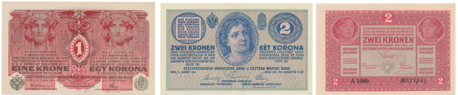
Rakousko-uherské jedno- a dvoukoruny, které nebyly připuštěny ke kolkování, zůstaly v platnosti až do 15. 10. 1919

korun, k okolkování jich bylo předloženo přes 7 miliard. Kolkované peníze zůstaly v oběhu až do června roku 1920, zatímco neokolkované oběživo (jedno a dvoukoruny) přestalo platit k 16. říjnu 1919. Současně v průběhu druhé poloviny roku 1919 byly postupně tištěny a uváděny do oběhu nové československé státopky.