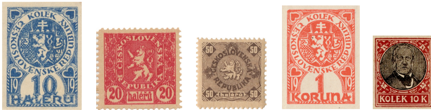
Kolky v hodnotách 10h, 20 h, 50 h a 1 K se lepily přímo na bankovku, vpravo je předloha 10 K kolku, který byl na bankovku vytištěn.

Jak přesně okolkování probíhalo? Jednalo se o náročnou organizační a legislativní akci. Po celé zemi bylo k tomuto účelu zřízeno 13 hlavních a 410 okresních komisariátů s přibližně 1500 sběrnami, které byly pověřeny sebráním a okolkováním bankovek. K okolkování byly nejprve připuštěny peněžní ústavy, potom venkovské obce, dále okresní město a nakonec obchodníci a živnostníci. Ti byli pod hrozbou ztráty koncese povinováni přijímat platby v neokolkovaných i kolkovaných bankovkách po celou dobu kolkovací akce. Obyvatelé Mrače se tedy pro nové peníze vypravili do Benešova. Každému z nich byla polovina jeho bankovek okolkována a tím se z nich staly československé státočky – první peníze Československé republiky. Druhá polovina se neokolkovala, byla mu zadržena a místo ní obdržel vkladní list, který představoval 1 % zúčitelnou pohledávku u Československé republiky v hodnotě zadržovaných korun. „Pohledávka tato se nesmí nikomu postoupiti. Co se s pohledávkou tou stane, určí se zvláštním zákonem.“ (např. mohla být použita na splacení dávky z majetku).