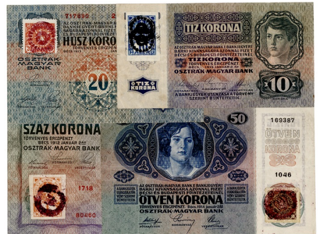
Zachycené a úředně znehodnocené státopky s padělanými kolkky