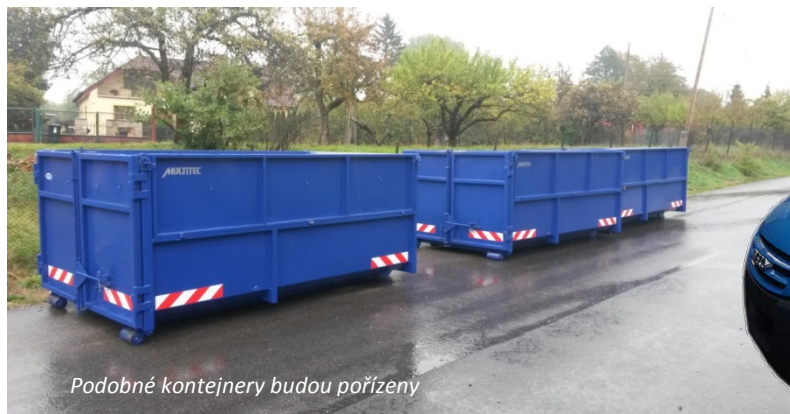
Podobné kontejnery budou pořízeny