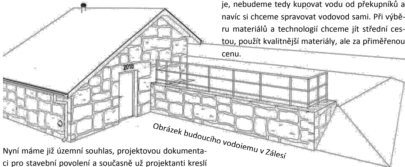
Obrázek budoucího vodojemu v Zálesí

V roce 2016 jsme začali s projektováním a během druhé poloviny loňského roku shromažďovali potřebná vyjádření a souhlasy. Stavbou hodláme zatížit povětšinou obecní, případně státní pozemky, přesto místy procházíme i přes pozemky soukromé. Kladně hodnotím přístup soukromých vlastníků, kteří nám velmi ochotně potvrzovali souhlasy. Krátce jsme se zadrželi na souhlasu od Želivské provozní a. s., která náš záměr podrobila hlubšímu zkoumání, zejména s ohledem na možná rizika a množství odebírané pitné vody. Připomenu, že se do společného projektu zapojily obce Čakov (pro Vlkov, Tatouňovice, Čakov), Divišov (pro Křešice), Ostředek (pro Ostředek a Mžížovice), Vranov (pro Vranov, Vranovskou Lhotu a Bezděkov), Teplýšovice (pro Teplýšovice a Čeňovice), Struhařov (pro Struhařov a Bořeňovice) a Chotýšany. Původně mělo dojít k napojení štol ve Vranově a v Křešicích, kde nad připojením v Křešicích visel od začátku otazník. Želivská provozní a.s. nakonec rozhodla, že připojení ve Vranovské Lhotě je neefektivní a více rizikové, a tak povolila připojit náš společný systém pouze v Křešicích. Musím podotknout, že povolená varianta je pro nás výhodnější. Vodu budeme jímat pouze do vodojemů v Zálesí a odtud distribuovat pitnou vodu gravitačně do všech připojených osad.